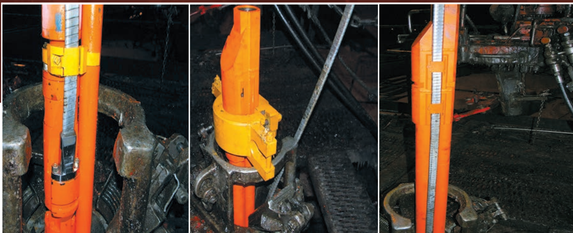
Рис. 2. Монтаж байпасной системы СБ146 с установкой 3-го габарита производства «Новомет» на месторождении

работала еще одна российская компания, но пока без положительных результатов внедрения.